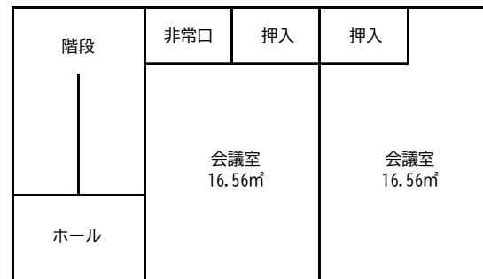
2 階 平面図